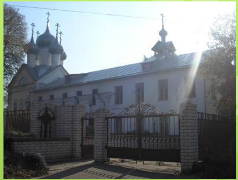
Церковь Сергия Радонежского.