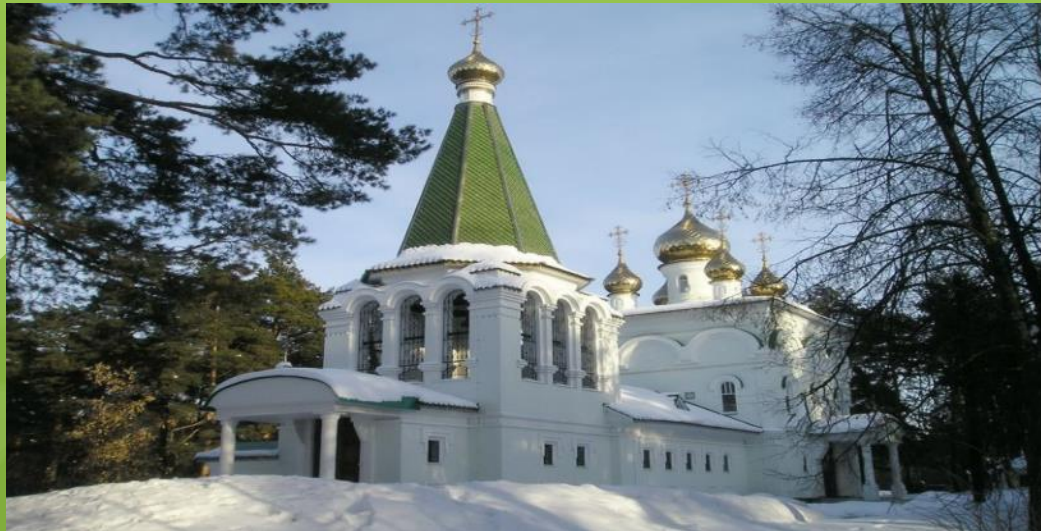
Церковь Покрова Пресвятой Богородицы.