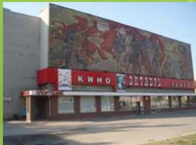
"Центр культуры Октябрь"