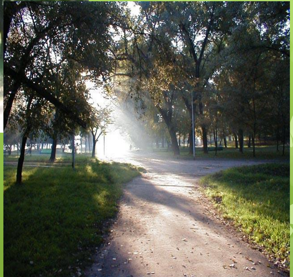
«Борский городской парк культуры и отдыха»