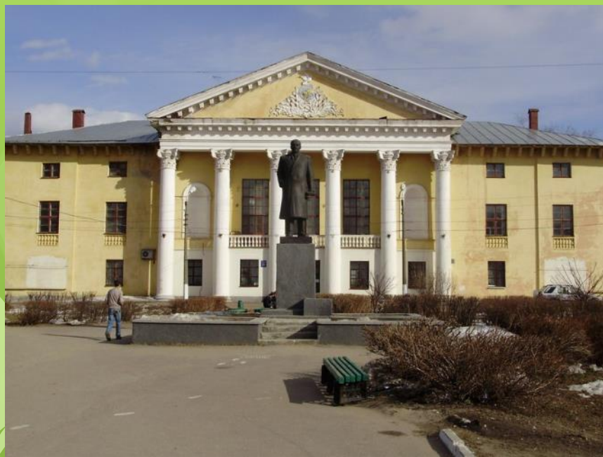
Дом Культуры «Теплоход» был создан в 1959 г.